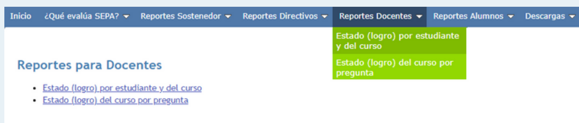
Imagen 1. Menú principal plataforma de resultados SEPA.

Estos reportes se encuentran en la pestaña "Reportes Docentes", tal como se muestra a continuación: